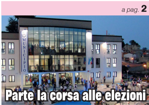
Parte la corsa alle elezioni

La Calabria è la terza regione più romantica d'Italia. Lo certifica l'Indice Cupido (ICU) 2026, elaborato da Casinos.com analizzando cinque anni di ricerche Google legate ai principali rituali di San Valentino: cioccolatini, cene romantiche, regali e hotel. Con un punteggio di 72,8 su 100, la Calabria chiude il podio dietro Basilicata (91,3) e Campania (80,0) e precede di misura Abruzzo e Umbria (72,5). Come vedete non sempre siamo agli ultimi posti delle classifiche. Solo che con il romanticismo non si campa! ■