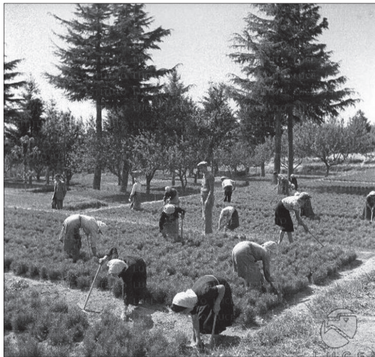
Vivaio di piante di pino

struito chilometri di muretti a secco, briglie nei torrenti per rallentare la furia delle acque e rifugi che oggi sono il cuore del nostro turismo montano. Hanno trasformato lo "sfasciume" in una foresta. Eppure, abbiamo permesso che questa categoria venisse marchiata dall'infamia mediatica di "esercito del voto" o, peggio, di "vagabondi". Oggi paghiamo il prezzo di