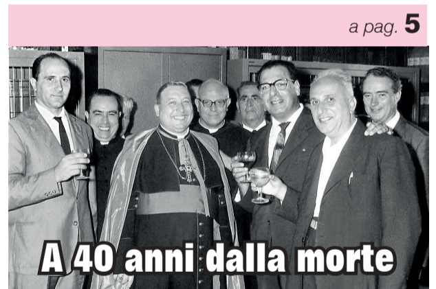
A 40 anni dalla morte