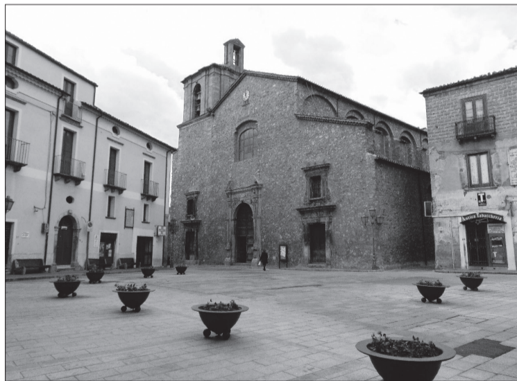
Piazza Abate Gioacchino - San Giovanni in Fiore

rismo può rappresentare una grande risorsa, non sempre garantisce comunque stabilità economica durante tutto l'anno. Questo può creare insicurezza e precarietà per molte famiglie. Dall'altro lato, vivere in un paese montano come San Giovanni in Fiore offre piccoli vantaggi. La qualità dell'ambiente è generalmente migliore: aria pulita, contatto diretto con la natura e ritmi di vita meno frenetici. Inoltre, si sviluppa spesso un forte senso di comunità. Le persone si conoscono, si confrontano, si aiutano e condividono tradizioni che rafforzano l'identità culturale del territorio. Questo aspetto contribuisce a creare relazioni sociali più solide rispetto a quelle spesso superficiali delle città. In conclusione, la condizione sociale ed economica a San Giovanni in Fiore presenta tante criticità e pochi punti di forza. Se da un lato l'isolamento e la mancanza di servizi possono rappresentare un limite, dall'altro la qualità della vita, la solidarietà e il legame con la natura costituiscono valori importanti. Per migliorare la situazione sarebbe necessario investire nei servizi, nelle infrastrutture e nelle opportunità lavorative, così da rendere il nostro paese un luogo non solo suggestivo, ma anche socialmente ed economicamente sostenibile. ■