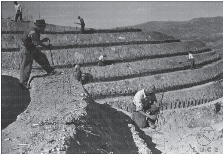
Lavori di rimboschimento in Calabria

“Sfasciume pendolo sul mare” così definì la Calabria Giustino Fortunato negli anni Cinquanta. Un'immagine cruda, quasi spietata, che ogni amministratore calabrese ha sentito risuonare nella mente al primo tuono di un temporale invernale. Per chi ha indossato la fascia tricolore in questa terra, il cielo scuro non è mai stato solo meteo; è sempre stato un presagio di isolamento, di strade che si spezzano e colline che si mettono in marcia verso la valle. Così ancora oggi quando l'inverno picchia duro e i bollettini della Protezione Civile si trasformano in cronaca di disastri annunciati, emerge una verità che per troppo tempo abbiamo preferito soffocare sotto il tappeto del pregiudizio: dove il bosco tiene, è perché qualcuno l'ha piantato e curato. Esiste una differenza geografica netta, quasi chirurgica, che emerge dopo ogni alluvione. Da un lato ci sono i versanti abbandonati a sé stessi, dove l'erosione mangia i fianchi delle montagne; dall'altro ci sono i perimetri in cui, tra l'epoca dell'Opera Valorizzazione Sila (O.V.S.) e i decenni successivi, hanno operato i forestali calabresi. In quelle aree, il territorio ha retto. Non per miracolo, ma per ingegneria naturalistica ante litteram. Quei lavoratori hanno co-