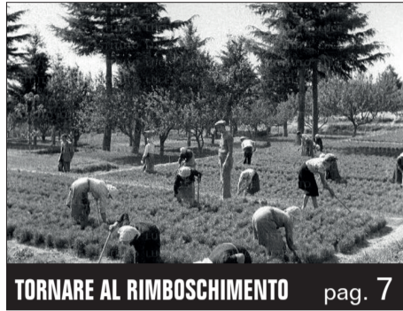
TORNARE AL RIMBOSCHIMENTO pag. 7