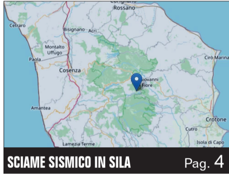
SCIAME SISMICO IN SILA Pag. 4