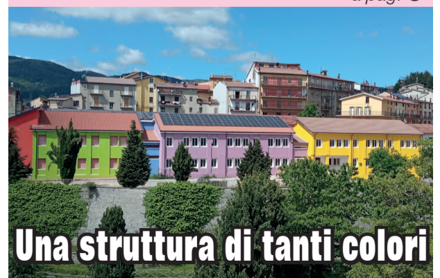
Una struttura di tanti colori