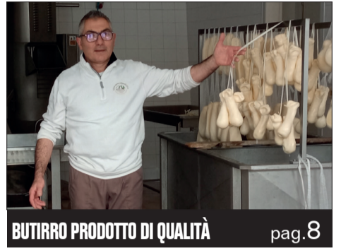
BUTIRRO PRODOTTO DI QUALITÀ pag. 8

Il popolo sangiovese è chiamato alle urne per il 24 e 25 maggio