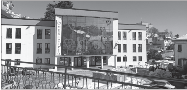
Municipio di San Giovanni in Fiore

Il comitato civico "18 Gennaio" punta alla sconfitta del centrodestra