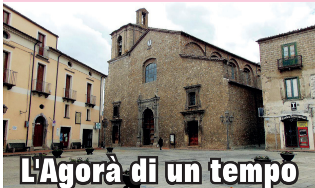
L'Agorà di un tempo