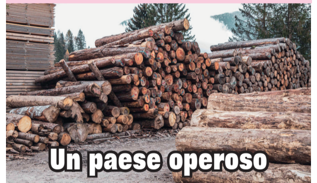
Un paese operoso