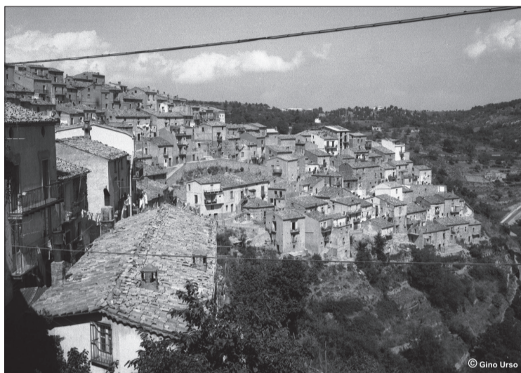
Panorama del Calvario - San Giovanni in Fiore

È soprattutto d'inverno che i fantasmi si fanno sentire. Quando c'è sempre, prima o poi, una finestra che sbatte dentro qualche casa chiusa da troppo tempo e nel silenzio di strade deserte il vento diventa la voce dell'assenza, il richiamo cioè di chi è partito per cercare altrove fortuna. Da anni, c'è un trasferimento costante in atto che determina lo svuotamento di San Giovanni in Fiore. Le scuole si ridimensionano per mancanza di bambini; il servizio sanitario è inadeguato; giudice di pace sempre a rischio; forze dell'ordine ridotte; uffici comunali quasi gestiti interamente dagli Isp - Ipu; giovani diplomati e laureati che scappano perché il lavoro non si trova; le banche che sempre più riducono il personale e automatizzano gli sportelli; il trasporto pubblico