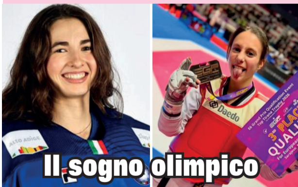
Il sogno olimpico