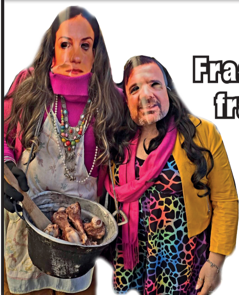
Frassie e frassari