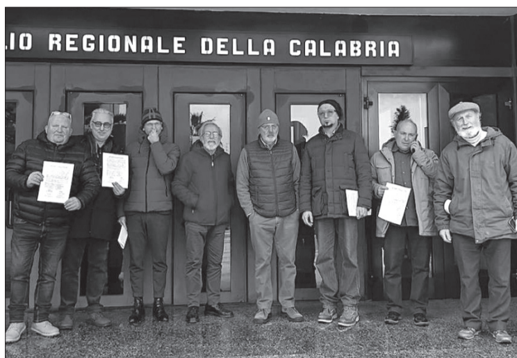
Il Comitato La Cura all'ingresso della Cittadella regionale

Garantire un'assistenza sanitaria a quanti scelgono di vivere nei propri paesi di montagna, cioè nelle zone interne della Calabria distanti parecchi chilometri dalle città capoluogo, è un dovere da parte dello Stato per contrastare anche lo spopolamento e l'isolamento di gran parte del paese. Da qui parte la richiesta dei cittadini di San Giovanni in Fiore, Acri, Serra San Bruno e Soveria Mannelli, che hanno deciso di unirsi nel Comitato "La Cura" promotore di una proposta di legge di iniziativa popolare di competenza del Consiglio regionale della Calabria, per il rilancio e la tutela dei quattro ospedali definiti "di montagna". L'iniziativa meglio conosciuta come "Curare sul posto" ha come obiettivo quello